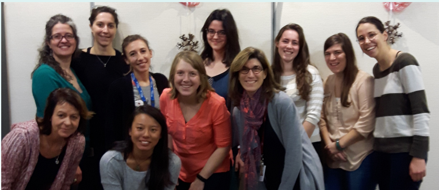
Les ergothérapeutes ont accueilli huit stagiaires l'année dernière.

Profitez du mois de l'ergothérapie, en octobre, pour contacter les ergothérapeutes de la Direction des programmes Santé mentale, dépendance et services psychosociaux généraux adulte pour en connaître davantage sur l'offre de service.