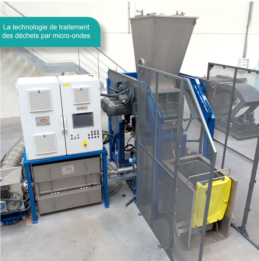
La technologie de traitement des déchets par micro-ondes